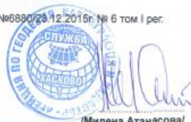
Схема № 15-987136-22.10.2020 г. издадена въз основа на заявление с входящ № 01-485111-20.10.2020 г.